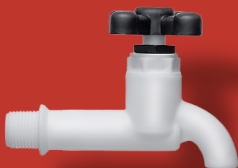
↘ TORNEIRA CURTA TANQUE Ref. 2020 Ø 1/2" ou 3/4"