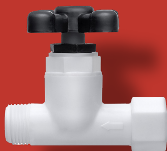
↘ REGISTRO Ref. 2400 Ø 1/2" ou 3/4"