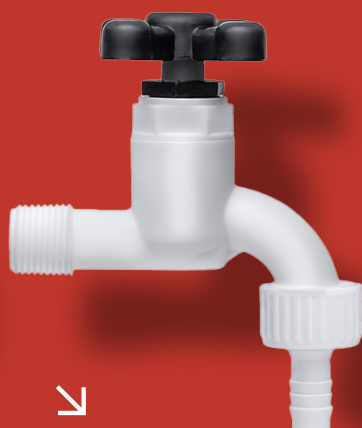
↘ TORNEIRA CURTA COMPLETA Ref. 2028-C Ø 1/2" ou 3/4"