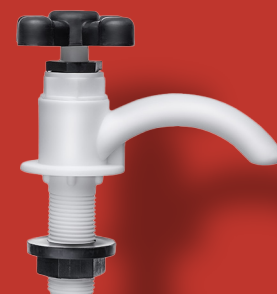
↘ TORNEIRA PARA LAVATÓRIO Ref. 2091 Ø 1/2"