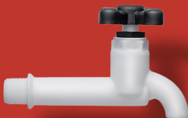
↘ TORNEIRA MEDIA TANQUE Ref. 2026 Ø 1/2" ou 3/4"