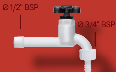
↘ TORNEIRA SLIM MÉDIA JARDIM Ref. 2030 S Ø 1/2" Ø 3/4"