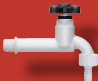
↘ TORNEIRA MÉDIA COMPLETA Ref. 2030-C Ø 1/2" Ø 3/4"