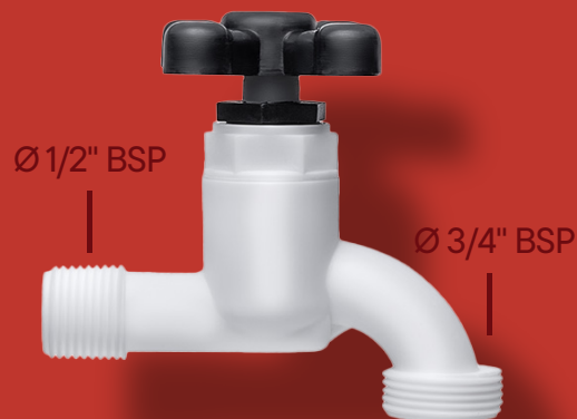
↘ TORNEIRA SLIM CURTA PARA JARDIM Ref. 2028 S Ø 1/2" Ø 3/4"