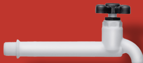
↘ TORNEIRA LONGA PIA Ref. 2058 Ø 1/2" ou 3/4"